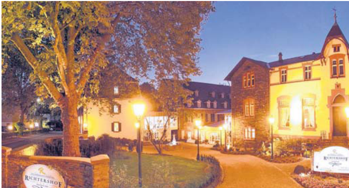
Ausstrahlung Einfahrt zum „Weinromantikhotel Richtershof“ mit seiner Kombination aus Historie und Moderne.

Weinprobe im – buchstäblich – Erdgeschoss eines Hotels, das sich dem Rebensaft verschrieben hat, dem „Weinromantikhotel Richtershof“ in Mülheim, fünf Kilometer entfernt von Bernkastel-Kues an der Mosel. Jeden Freitag ab